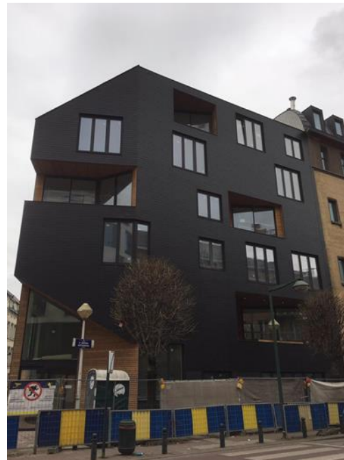
Verbouwing Lokaal Dienstencentrum De Harmonie