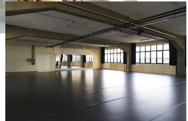
Inrichting studio Peeping Tom