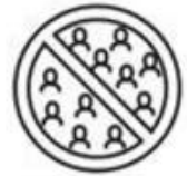
Volg de regels over bijeenkomsten

Naast de 6 gouden basisregels moet elk protocol meer specifiek voldoen en rekening houden met 10 basiselementen. Deze 10 geboden zijn noodzakelijk om elke activiteit op COVID-veilige wijze te kunnen laten doorgaan en moeten dus in elk protocol of elke gids terug te vinden zijn. Het gaat om volgende geboden :