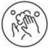
Respecteer de hygiëneregels

Als algemeen principe blijven de zes gouden regels van toepassing op elke activiteit .