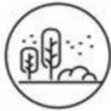
Doe je activiteiten liefst buiten