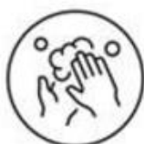
Respecteer de hygiëneregels

Als algemeen principe blijft het nuttig om de aanbevelingen die we het voorbije jaar gehanteerd hebben te volgen. De zes gouden regels blijven in vele gevallen relevant in de samenleving, ook al zijn voor sommige activiteiten de specifieke regels er soepeler of zonder beperkingen bij sommige van de culturele activiteiten.