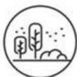
Doe je activiteiten liefst buiten