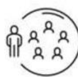
Beperk je nauwe contacten