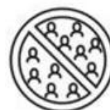
Volg de regels over bijeenkomsten

Diezelfde blik geldt voor de 10 geboden. Het blijft een nuttige algemene insteek om waar van toepassing met deze 10 geboden rekening te houden ook al zijn regels in sommige gevallen soepeler of zonder beperkingen bij culturele activiteiten.