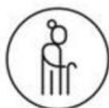
Denk aan kwetsbare mensen